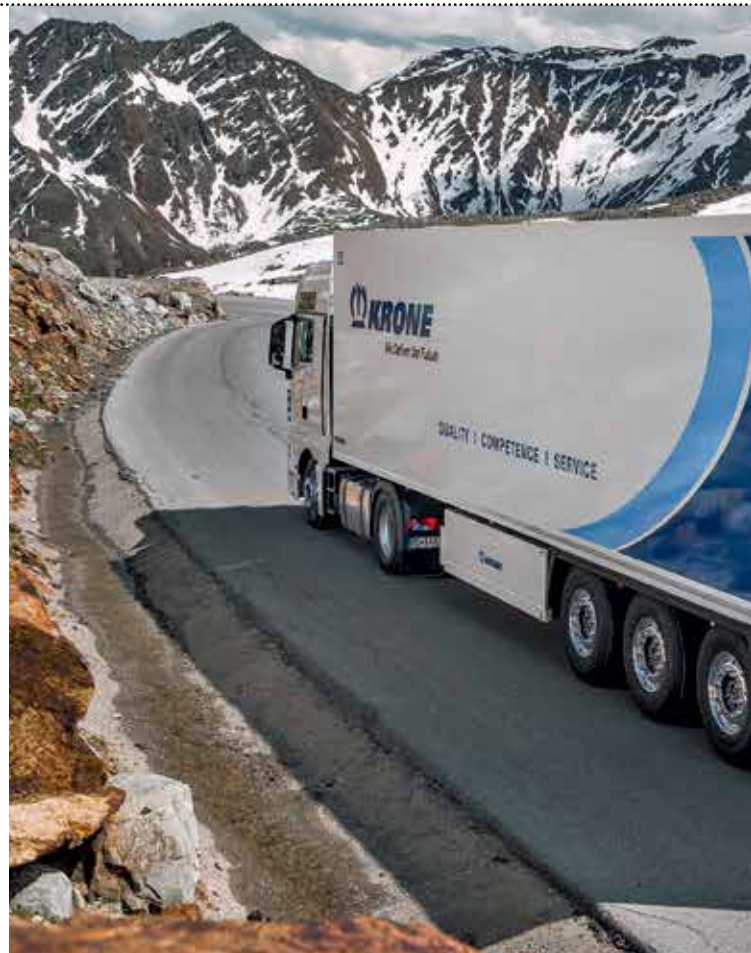
Pri modelih Cool Liner je poudarek na večji zaščiti prikolice ob parkiranju na nakladalno rampo ter novi predelni steni za dvorežimsko delovanje.

ja na vsak poskus odpiranja. Kapacitivni senzor nivoja goriva v kombinaciji z LED-indikatorjem na sprednji steni in s Kronovo telemetrijo zagotavlja zanesljive in najnovejše informacije o polnosti rezervoarja hladilnega agregata. Prispevki za varnost v prometu zagotavljajo gabaritne zadnje luči na zgornjem delu